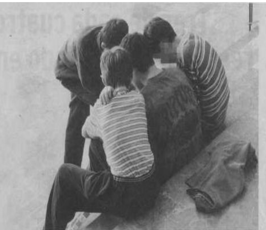
Los expertos recomiendan vigilar a las personas del entorno más cercano de los menores.